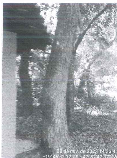
Figura 1 – Cedro morto.